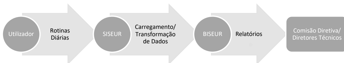
Figura 2 - Integração do BISEUR no SISEUR

O PO SEUR tem implementado um Sistema de Informação (SISEUR) que tem como objetivo a gestão de informação referente a projetos candidatos e aprovados a financiamento através do PO SEUR. O sistema corre em ambiente Web através do browser e permite a realização de operações de introdução, alteração, remoção e pesquisa. A integração do BISEUR com o SISEUR será da seguinte forma: